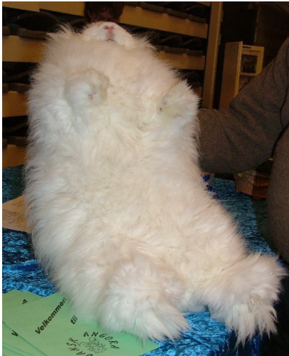
Angora, hvid topdyr

Under 2. Verdenskrig var Angora en mangelvare.