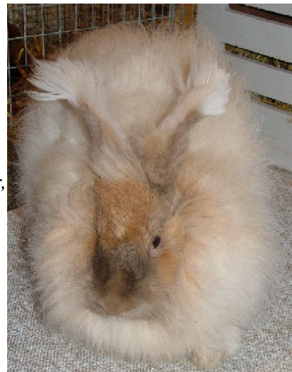
Angora findes også i andre farver, men hvid er den mest almindelige

Ulden er blød, og så har den en isoleringsevne, der er 8 gange større end fåreuld.